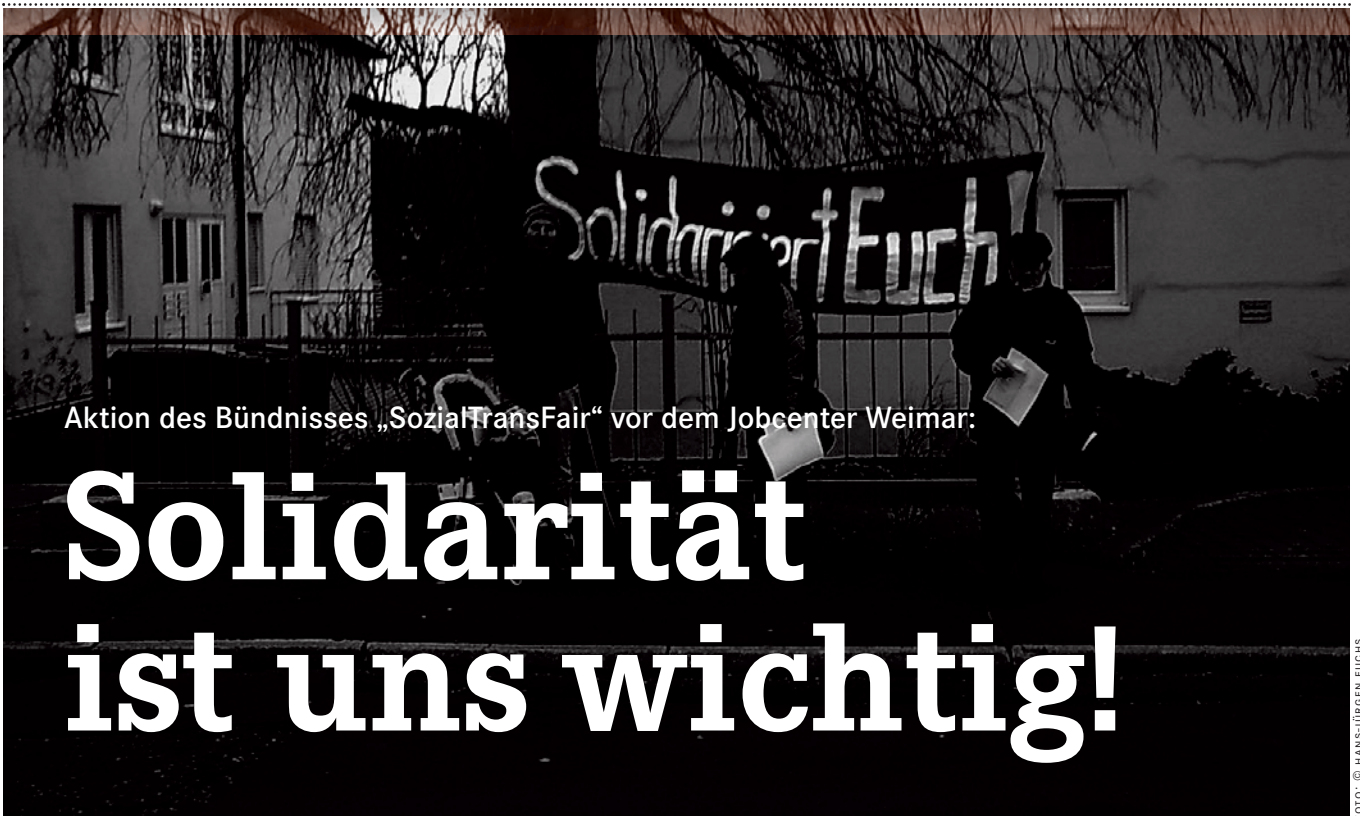
Aktion des Bündnisses „SozialTransFair“ vor dem Jobcenter Weimar: