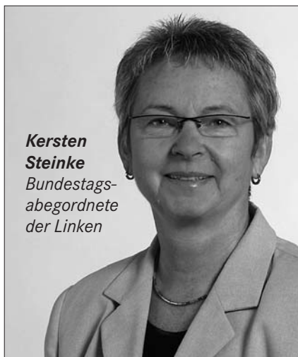
Kersten Steinke Bundestagsabgeordnete der Linken

Berlin/Apolda. // Es gibt in Deutschland Gebiete dichter ärztlicher Versorgung. In anderen Regionen weist die Versorgung Lücken auf. So fehlen Facharztpraxen insbesondere im ländlichen und kleinstädtischen Raum in Ostdeutschland, so auch in Thüringen. Die wohnortnahe Gesundheitsversorgung aller Menschen basiert auf einer umfassenden Bedarfsplanung. Es fehlen aber Daten über den Bedarf an gesundheitlicher Versorgung. Kersten Steinke, linke Thüringer Bundestagsabgeordnete dazu: „Gesundheit ist das A und O im Leben. Eine Flächen deckende und ausreichende Versorgung vor Ort, wo die Menschen leben, wohnen und arbeiten,